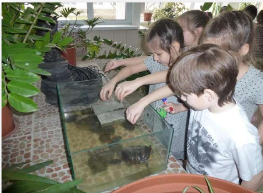
Экскурсии и наблюдения в аквазоне.