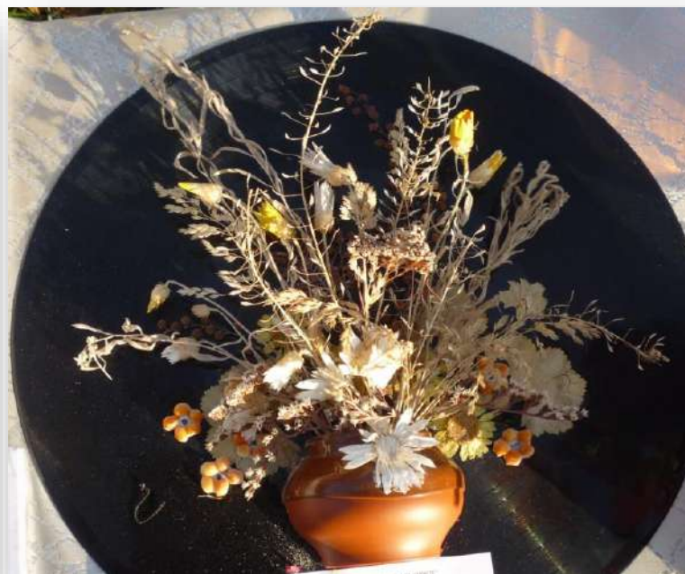
Осенние рапсодии Донских степей.