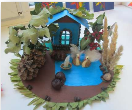
Лебеди на Чистых прудах.