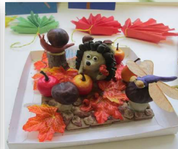
Столовая для ежика Пыха.