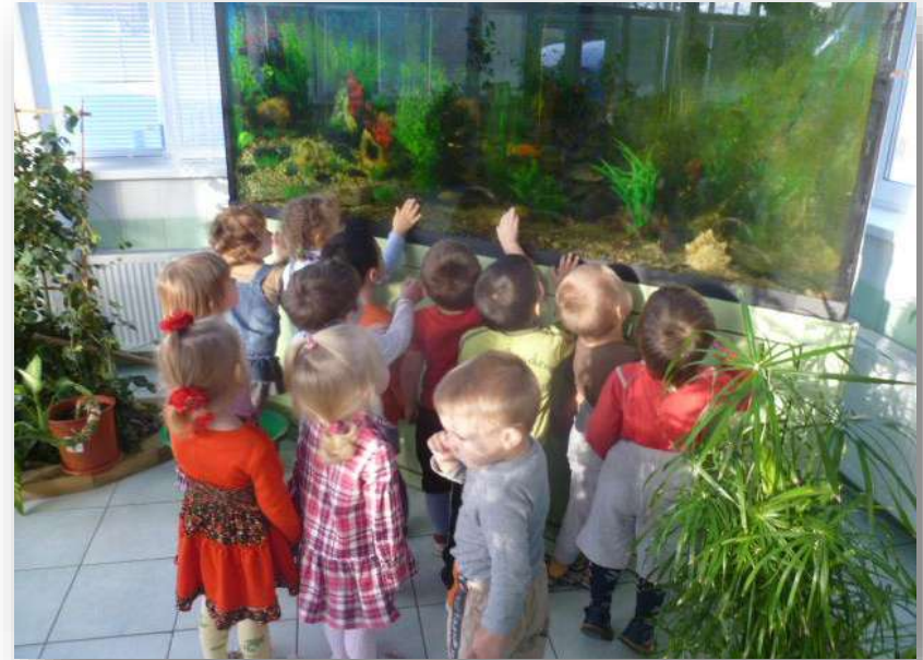
Постигаем Азбуку природолюбия с образами Героев-Эколят.